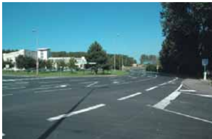
Pont des 7 Planètes ▲

Couches de roulement et nouvelles signalisations au sol