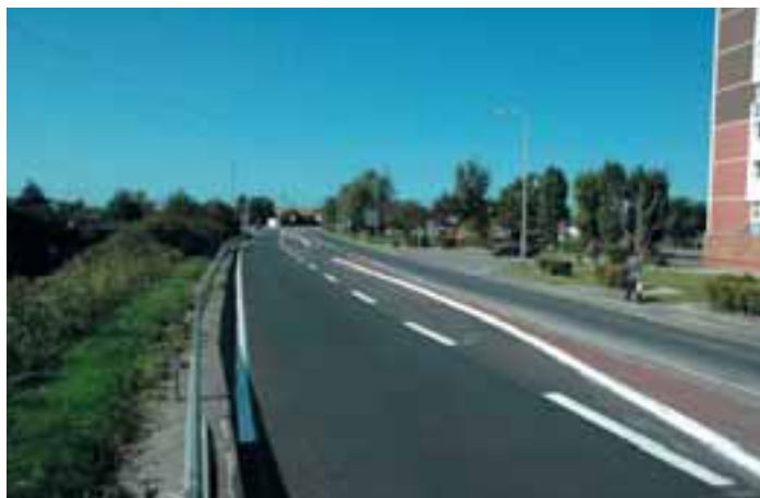
▲ Route de Steendam