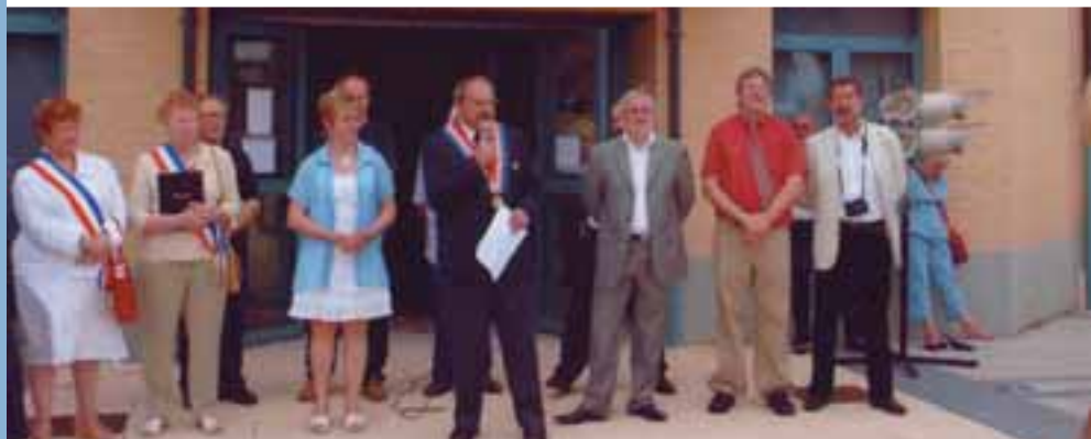
Festivités à Coudekerque-Village