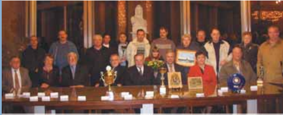
Assemblée Générale du Messenger

C'est un budget qui, en tout point, a tenu compte de l'intérêt général des nordistes.