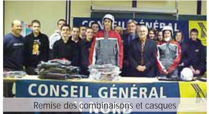
Remise des combinaisons et casques

Un recrutement sur le niveau 5 ème permet de sélectionner après un entretien 8 élèves sur 12 candidats.