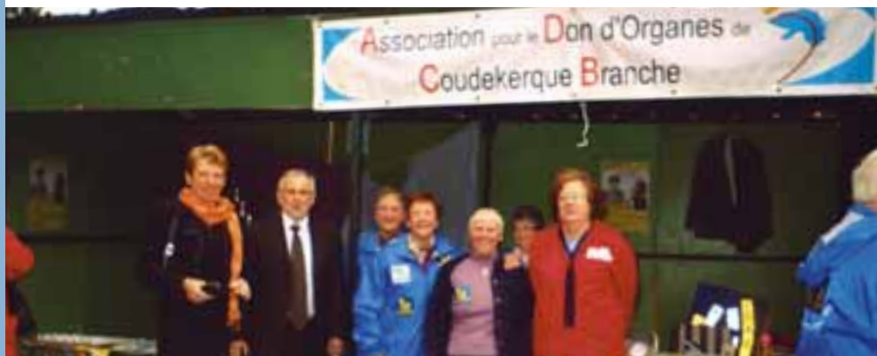
Remise du calicot à l'association pour le Don d'Organes de Coudekerque-Branche