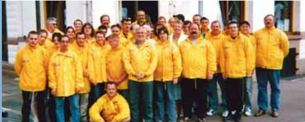
Achat de blousons pour l'Association India Tango